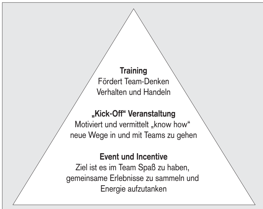
Ziele von Outdoors

Ziele von Outdoor-Konzepten können vielfältig und umfangreich sein. Um einen Überblick zu erhalten bietet es sich an, die drei Angebotsebenen 114 näher zu betrachten: